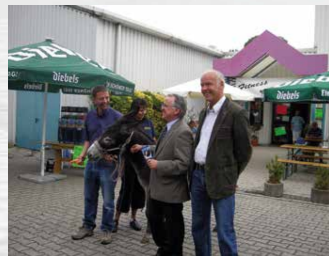
Eröffnung Gewerbefest_2008