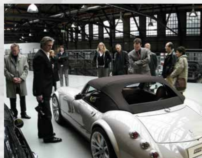
Unternehmertreff-WGZ-Bank + Meilenwerk Düsseldorf_2008