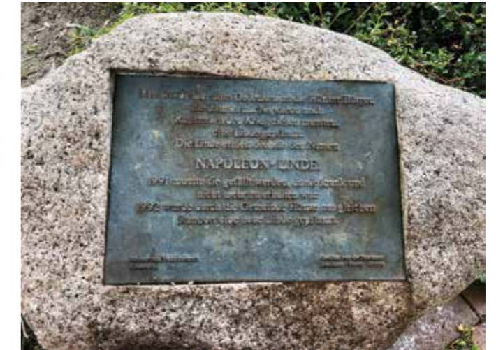
Gedenktafel am Fuß der Napoleon-Linde