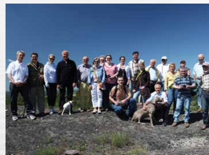
Unternehmertreff-Haldenbesichtigung Hünxe-Bruckhausen_2009

info@wirtschaftsgemeinschaft-huenxe.de www.wirtschaftsgemeinschaft-huenxe.de