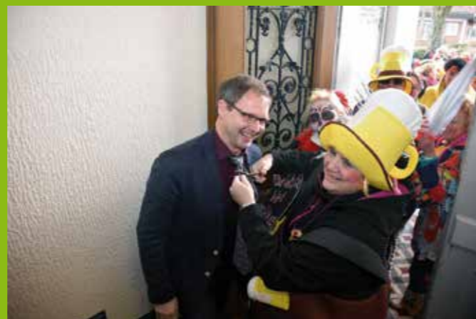
▲ Sturm auf's Rathaus/I. KV Jeck in Hünxe