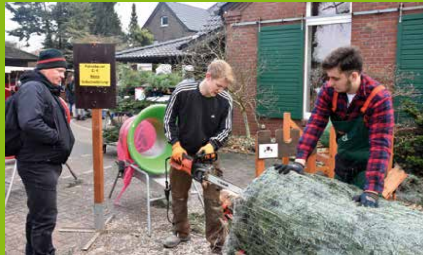
▼ Weihnachtsmarkt Schulte Drevenacks Hof ▼