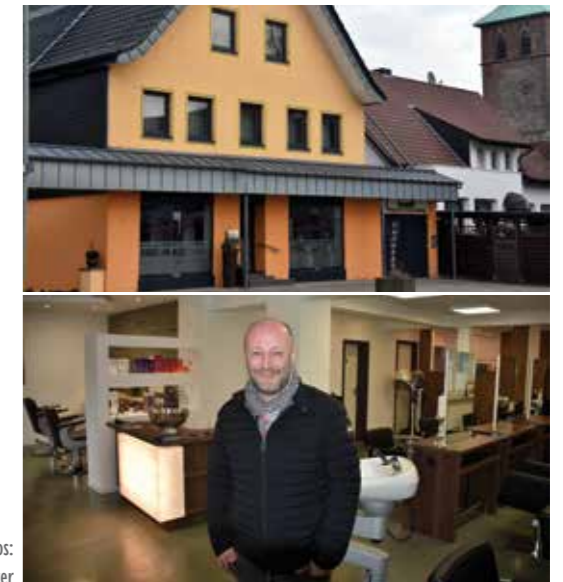
Text + Fotos: Hans Nover

Das gegenüber der Hünxer Dorfkirche gelegene Friseurgeschäft Beckmann wurde bereits im April 1945 gegründet. Im November 2009 übernahm Dirk Muhra den Betrieb. Seinen Wunsch, den Kunden ein Wohlfühlambiente in großzügigeren Räumlichkeiten anzubieten, verwirklichte er im Dezember des letzten Jahres durch eine Betriebsverlagerung zur Alte Weseler Straße 2. Hier kann er mit seinen fünf Mitarbeiterinnen noch mehr Serviceangebote realisieren.