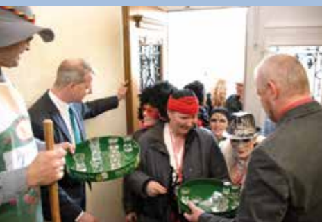
◀ Sturm auf's Rathaus/1. KV Jock in Hünxe ▶