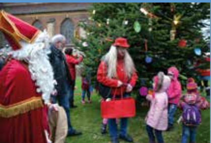
▲ Weihnachtsmarkt in Hünxe