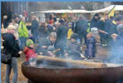
▲ Weihnachtsmarkt Schulte Drevenacks Hof