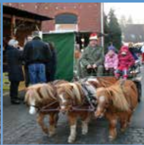
▲ Weihnachtsmarkt in Drevenack