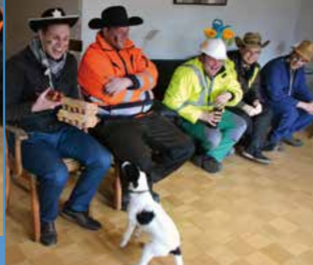
◀ Wurstjäger vom Bannemer Huck bei der WGH ▶