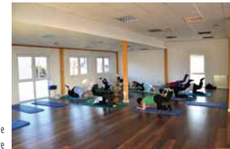
Neue Trainingsfläche Eingang B, 1. Etage