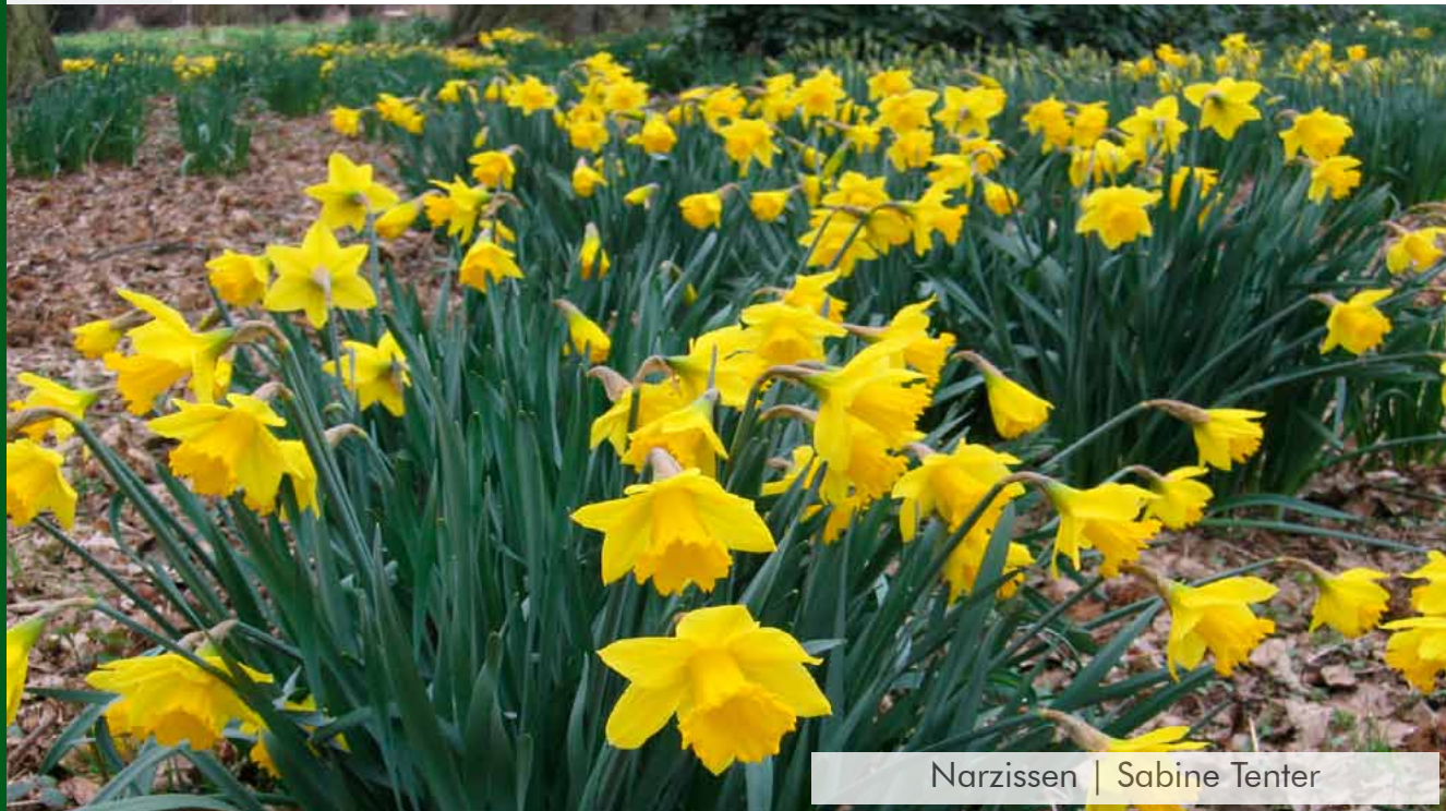
Narzissen | Sabine Tenter

Mitte August 2009 wird unser nächster Newsletter herauskommen. Wiederum soll eine Mitgliedsfirma mit Bild und Text vorgestellt werden, damit das Wissen um die Angebote und Leistungen der Mitglieder untereinander verbessert wird und somit Möglichkeiten zur Zusammenarbeit sichtbar werden. Sollten Sie Interesse an der Präsentation Ihres Firmenprofils haben, bitten wir um Rückmeldung per Fax 02858-83552 oder an: hans-nover@t-online.de