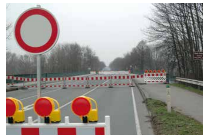
© Hans Nover – März 2011