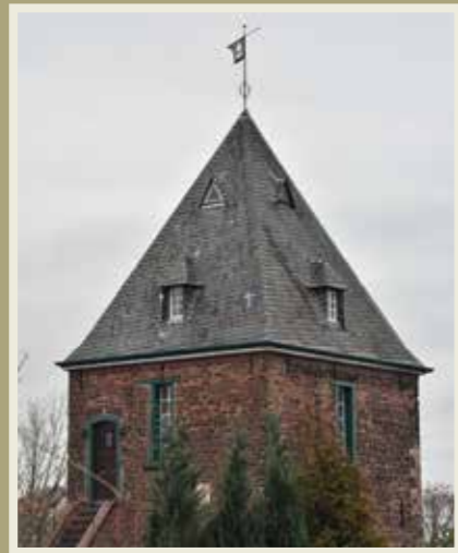
Bild 5

Lediglich einer von ursprünglich drei zweigeschossigen Ziegtürmen existiert noch. Er ist denkmalgeschützt. Die Inschrift „AGVV 1664“ belegt, dass Alexander Graf von Velen den quadratischen Turm erbaut hatte (Bild 5).