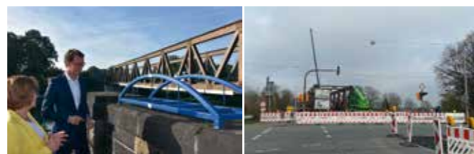
13. Sept 2021 und 11. Nov 2021

Am 12.11.2021 wurde die für 200.000 €/a angemietete Behelfsbrücke wieder auf die nördliche Kanalseite zurückgezogen und anschließend demontiert.