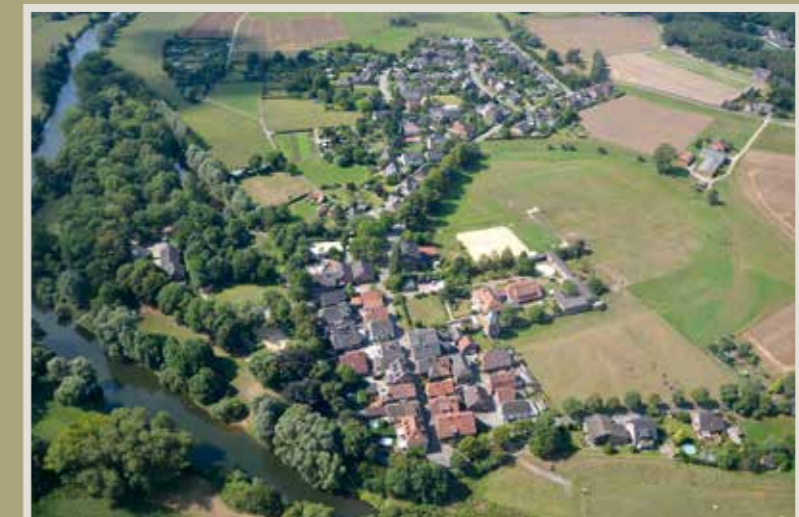
© Hans Nover – Bild 1 aus dem Jahr 2013

Seit 1827 ist das Anwesen kein Adelssitz mehr. Ein Stich aus dem 18. Jahrhundert zeigt das Haus Krudenburg, das im Jahr 1893 zum größten Teil einem Brand zum Opfer fiel (Bild 4).