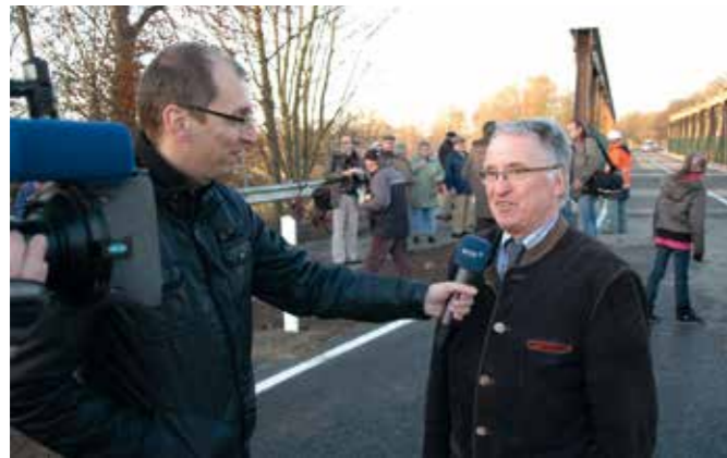
© Hans Nover – November 2011

Der WDR befragte Bürgermeister Hermann Hansen, der zur Realisierung der Behelfsbrücke maßgeblich beigetragen hat.