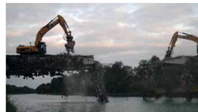
© Hans Nover – Juni 2011

Die zu geringe Durchfahrhöhe der Krudenburger Brücke blieb jedoch weiterhin problematisch. Das erst im Jahr 1950 fertiggestellte Bauwerk rechts im Bild wurde schon zehn Jahre später durch einen unmittelbar daneben errichteten Neubau ersetzt. Vor dem Jahr 1950 führte der Weg auf die nördliche Seite des Kanals über die Schleuse. Er wird auch heute noch von Fußgängern und Radfahrern genutzt.