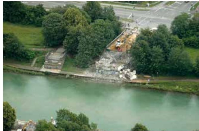
© Hans Nover – Juni 2011

Der Weg zum Widerlager der ersten Brücke führt durch einen Tunnel unter der Gahlener Straße (L463).