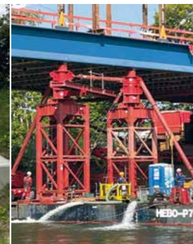
Höhenregulierung mittels Ponton