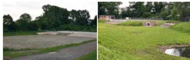
Das neue Drevenacker Regenüberlaufbecken (RÜB) mit Regenrückhaltebecken (RRB) ist östlich der LI zu sehen. Ein baugleiches Becken steht in Hünxe an der Straße Im Sand.

Eines dieser weitgehend unterirdischen Netze ist das Abwassersystem. Wer von Hünxe aus über die LI nach Drevenack fährt, kommt in Höhe des Ortes Krudenburg zunächst an der Kläranlage vorbei, die in den Jahren 2009/2010 modernisiert wurde. Seitdem wird ein Teil des Abwasserstroms mit modernster Membrantechnologie filtriert. Abwasser aus Bucholtswelmen, Drevenack, Gartrop, Krudenburg und Hünxe wird dabei von kleinsten Verschmutzungen, wie Medikamentenresten, Bakterien und Viren befreit. Zusammen mit der weiterhin eingesetzten biologischen Klärtechnik werden durchschnittlich 2595 m 3 Abwasser pro Tag gereinigt, Stand: 2020, (Luftbild oben). Solche gleichmäßig zugeführten Durchschnittsmengen kann das Hünxer Klärwerk gut bewältigen. Bei langanhaltendem Starkregen kommen über die Mischwasserkanäle jedoch so große Wassermassen beim Klärwerk an, dass dessen Kapazitätsgrenze überschritten werden könnte. Um diese Situation zu verhindern, wurden die in Hünxe und in Drevenack betriebenen Regenüberlauf- und Rückhaltebecken gebaut, die beide erneuert und erweitert worden sind.