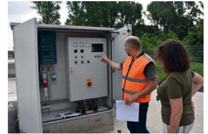
Mess-Sonde zur Füllstandsüberwachung