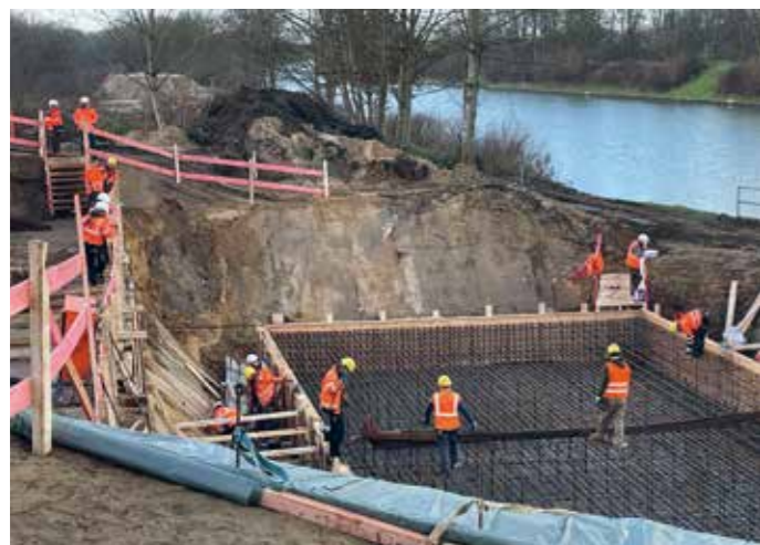
Neue Widerlager herstellen

Das Oberflächenwasser im Bereich des Brückenbauwerks wird aufgefangen und in einer Sedimentationsanlage gesäubert. Das gereinigte Wasser fließt in Versickerungsmulden nördlich und südlich des Kanals.