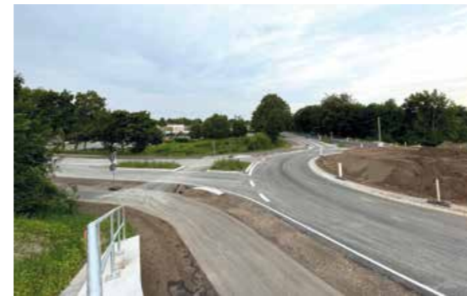
Kreisverkehr am 4.6.22 freigegeben