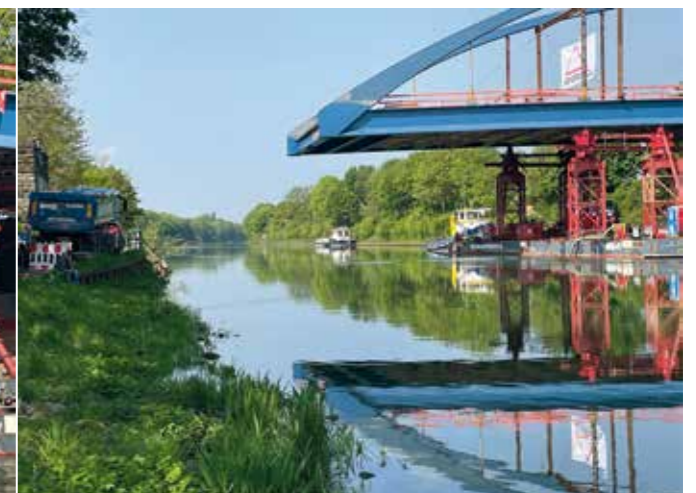
Seitenregulierung: Stahlseile zwischen 4 Lkws und 4 Winden auf Ponton ziehen die Brücke