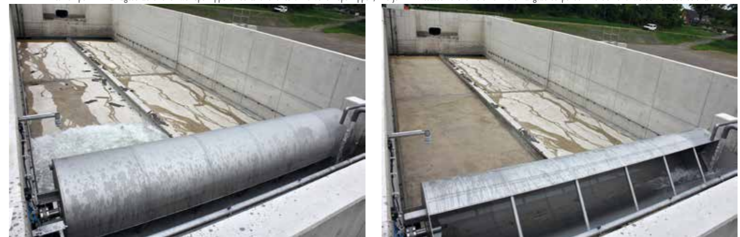
Schwallspülung der Spülkippe links reinigt den linken Teil des Beckenbodens