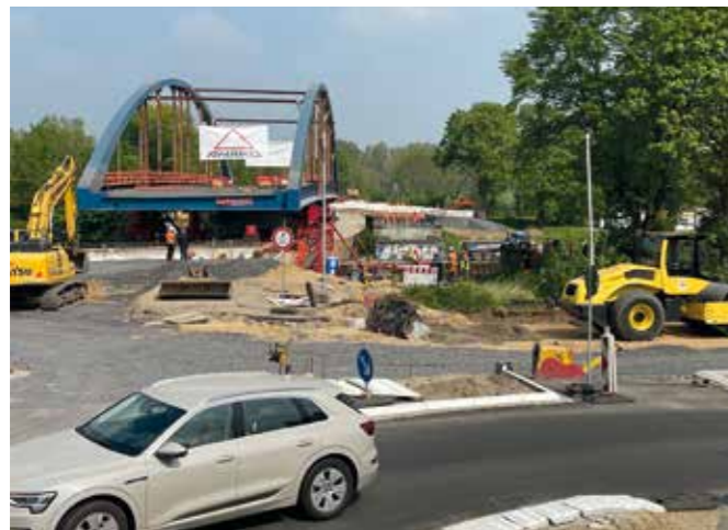
Fahrbahn L 463/L I sanieren