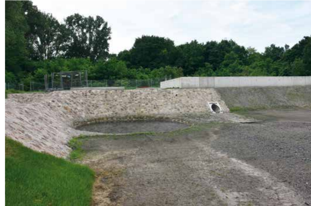
Regenrückhaltebecken vorn, Regenüberlaufbecken hinten.