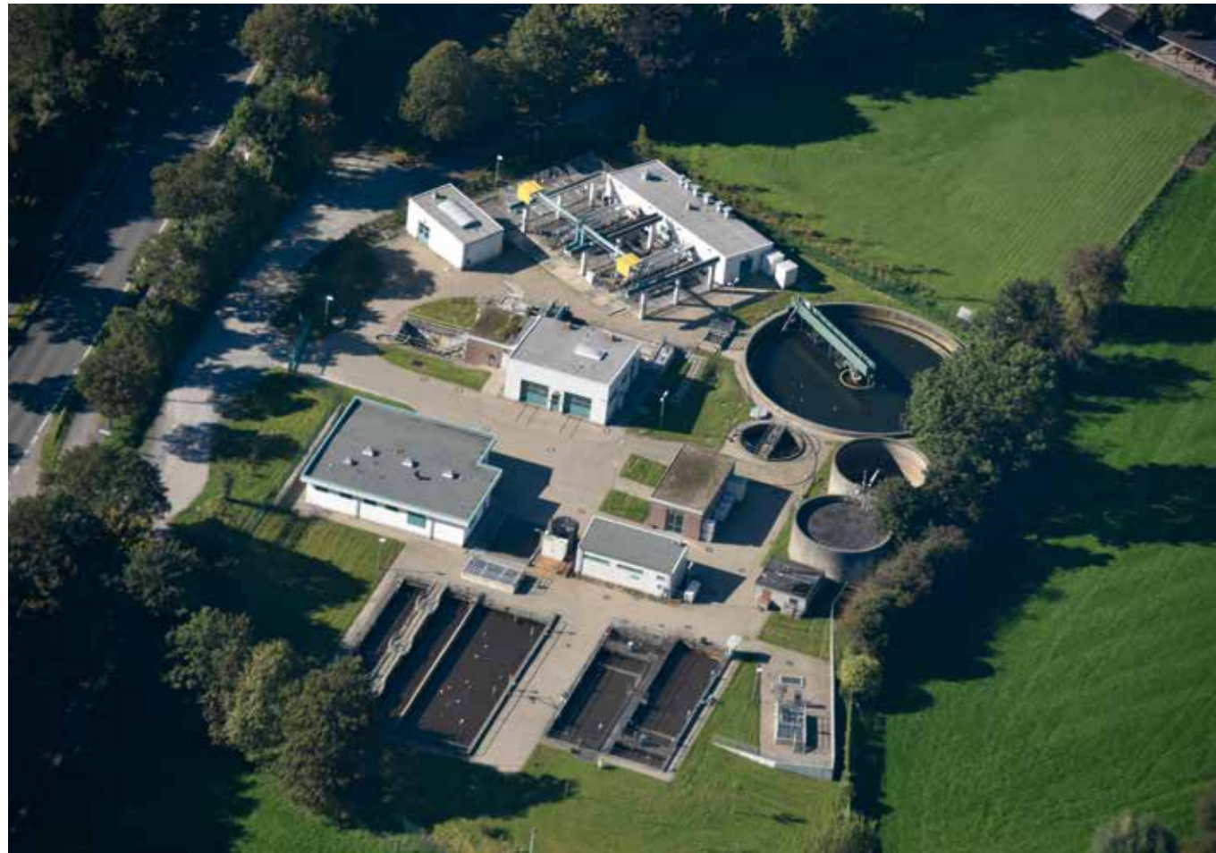
Kläranlage Hünxe nahe L I in Krudenburg