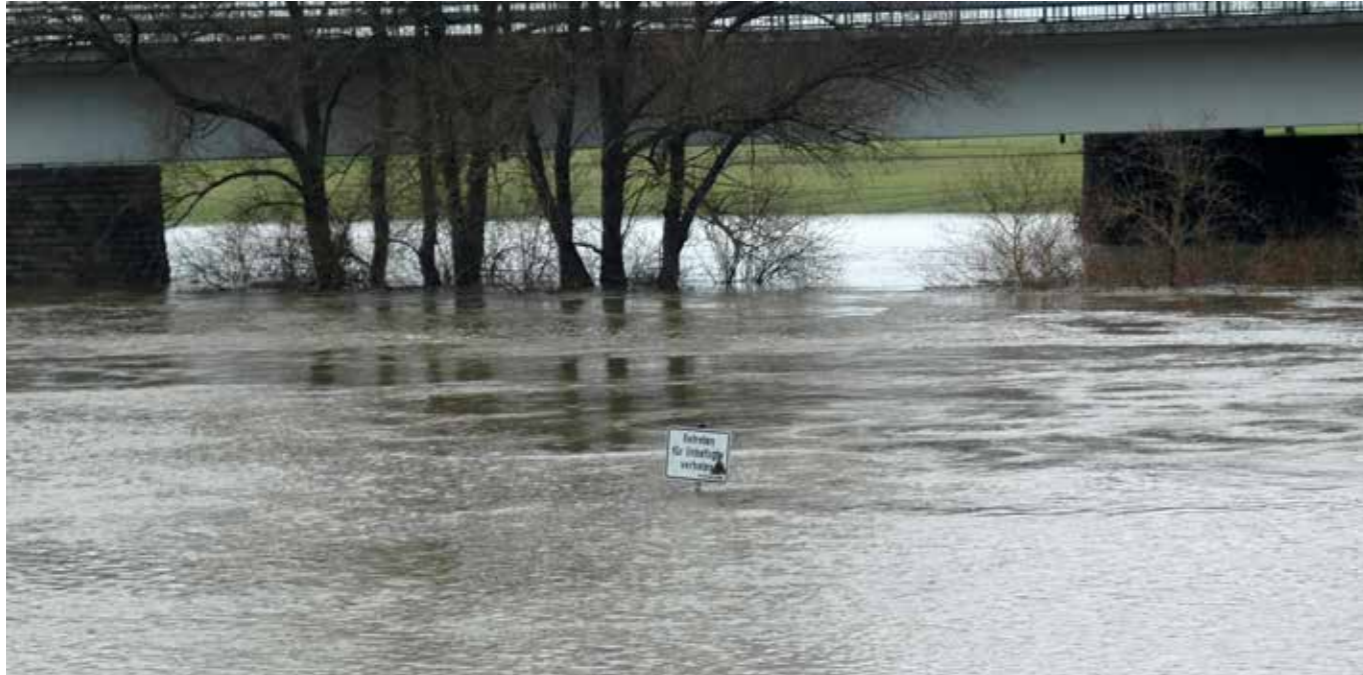
Bei Hochwasser darf das Regenüberlaufbecken nicht aufschwimmen.