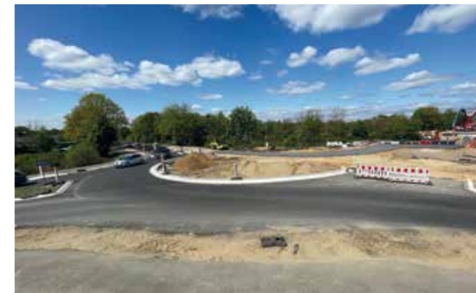
Kreisverkehr im Kreuzungsbereich von L 1/L 463 bauen