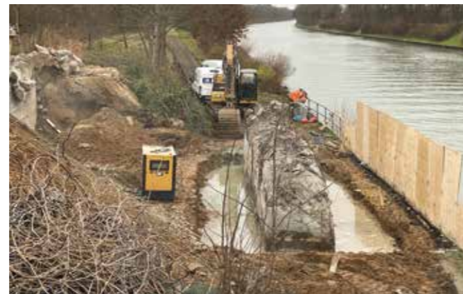
Behelfsbrücke und Betonfundamente (Widerlager) zurückbauen

Nach Vorgabe des Landesbetriebs Straßen NRW darf die L1 maximal neun Monate gesperrt sein. Eine Vertragsstrafe im Falle einer Bauzeitverlängerung und die hohe Leistungsfähigkeit der beauftragten Firma haben dazu geführt, dass nach gegenwärtigem Stand mit einer Bauzeitverkürzung von ca. einem Monat zu rechnen ist. In der vorgegebenen Zeit muss die Baufirma folgende Arbeiten abgeschlossen haben: