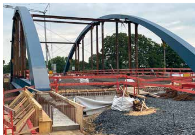
Ankündigung: Im August 2022 Fertigstellung der L I nach Drevenack