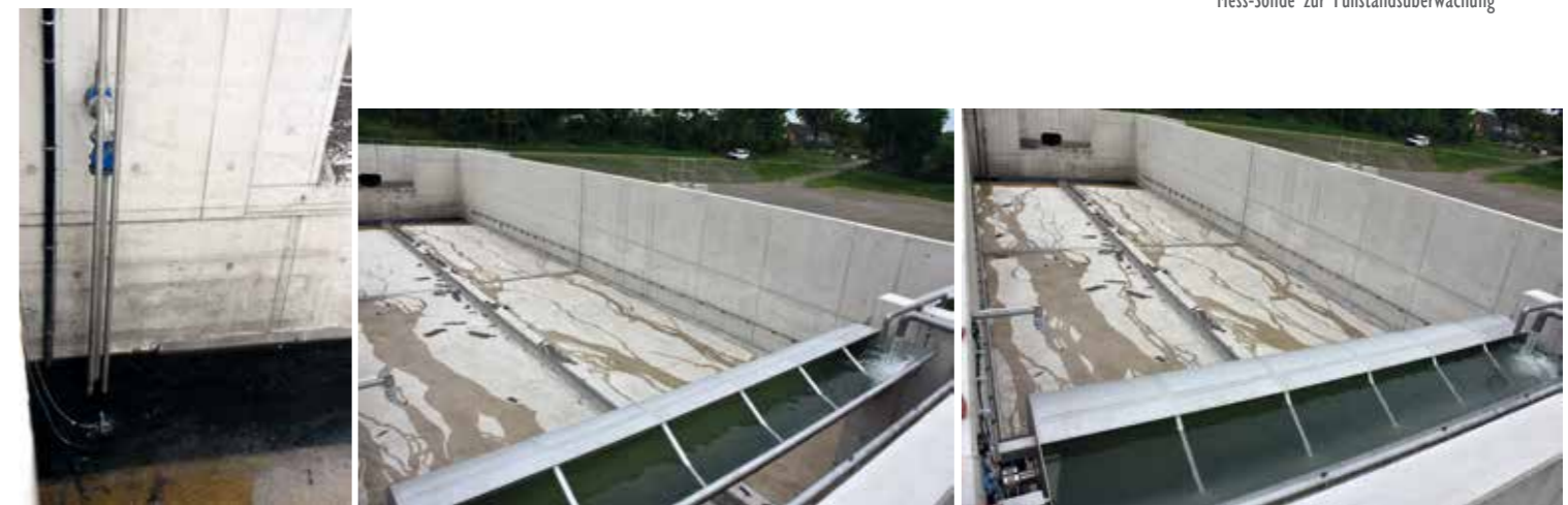
Links: Pumpe im Drainageschacht füllt zwei Spülkippen. Rechts und unten: Die vollen Spülkippen, mit je 9 m 3 Wasser drehen sich um die Längsachse pendeln zurück und werden erneut befüllt.