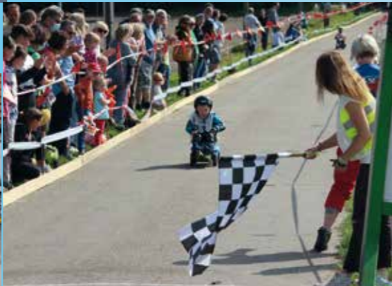
▲ Bobbycar-Rennen in Bruckhausen