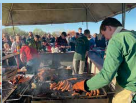
▲ Osterfeier des JSV Hünxe