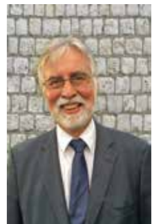
Eduard Strych Redaktion & Lektorat