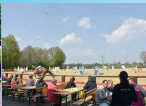
▲ Frühjahrsturnier Wanderfalke Drevenack