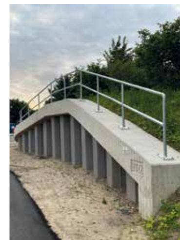
Ausführung eines Bauwerks als Spundwand