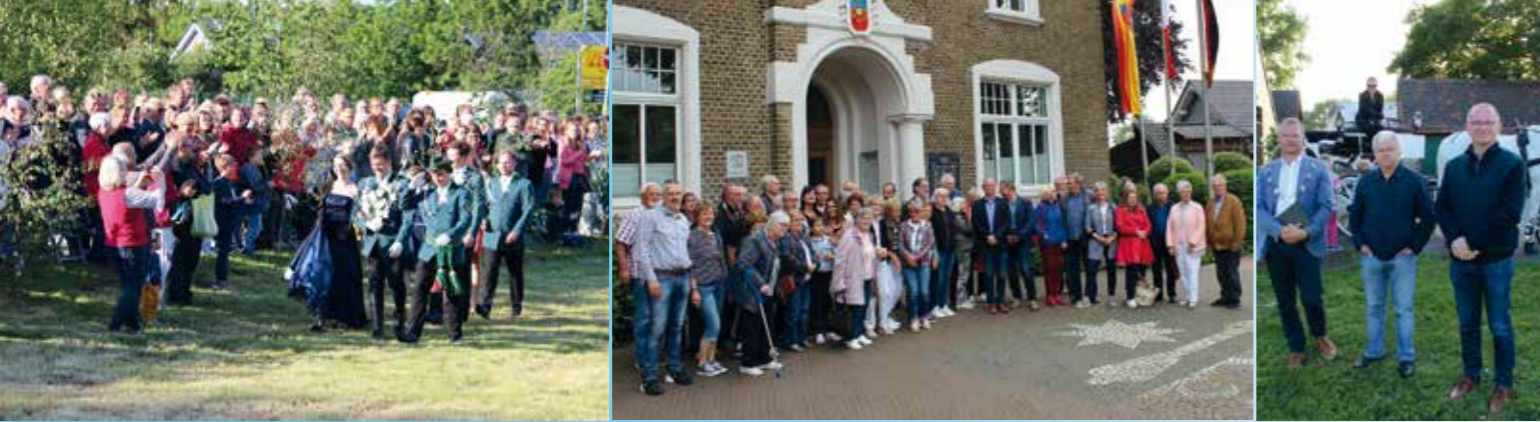
▲ 600 Jahre JSV Hünxe © Eduard Strych