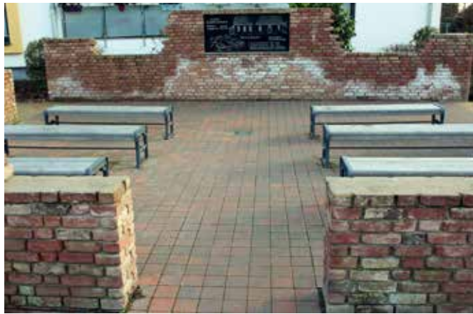
Einweihung historisches Klassenzimmer der Alten Dorfschule Bruckhausen