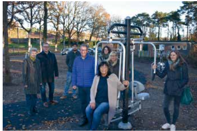
Outdoor-Fitnessanlage in Drevenack