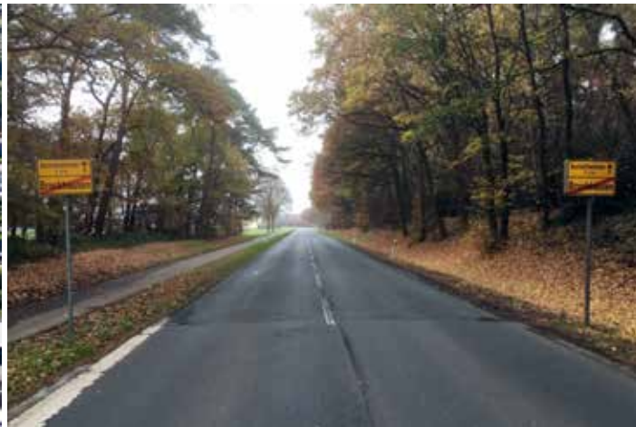
Bruckhausen, Sternweg (K 16)