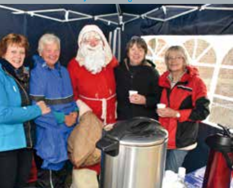
◀ Weihnachtsmarkt in Drevenack ▶