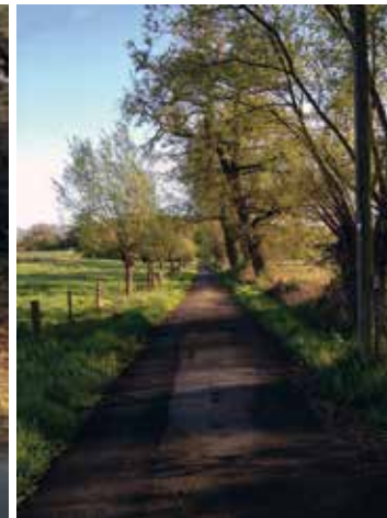
Hünxe, Gansenbergweg (Wirtschaftsweg)