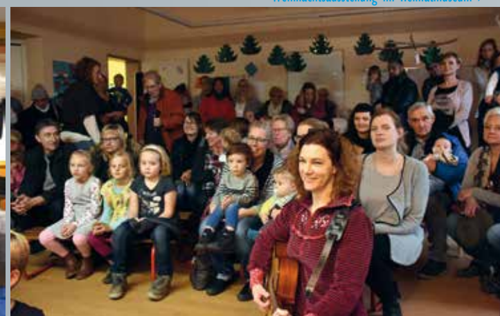
◀ Verleihung der „Toni singt“-Plakette an Kita KommRein Hünxe ▶