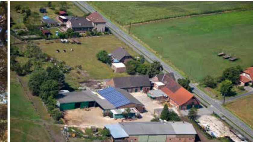
Hünxe, Wilhelmstraße (L 397)