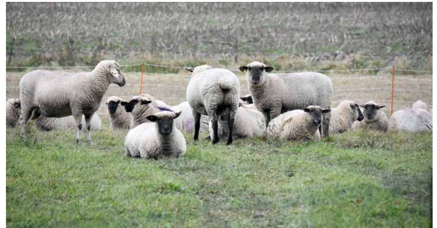
Schafsherde am Gansenbergweg; umgeben von einem 90 cm hohen Elektrozaun. Text und Foto: Hans Nover