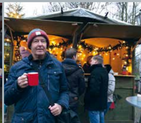
◀ Weihnachtsmarkt in Krudenburg ▶