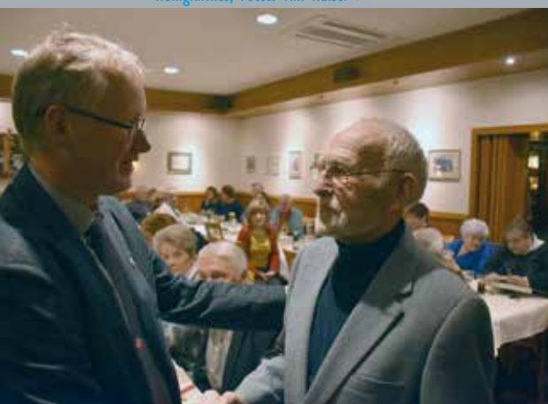
◀ Jubilärs-Ehrung ▶