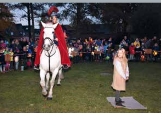
◀ Martinszug ▶