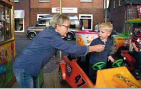
◀ Kirmes in Drevenack ▶