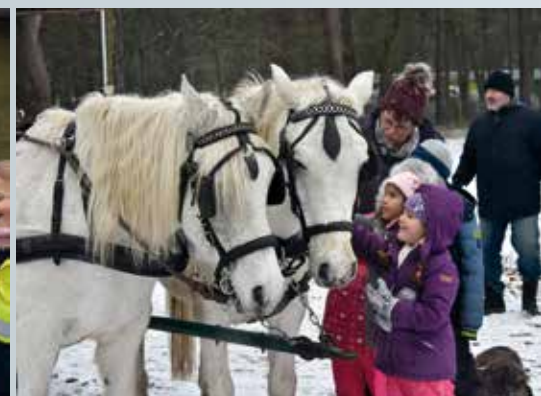
◀ Weihnachtsmarkt Schulte-Drevenacks Hof ▶