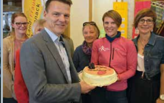
◀ 5 Jahre Frauenträume ▶