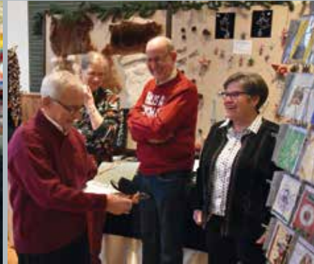
◀ Weihnachtsausstellung im Heimatmuseum ▶