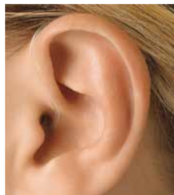
Ohr-HiFis: Nahezu unsichtbar.

Die Kunden sind nicht nur von dem Klang der hohen Töne, der Musikwiedergabe sowie der Sprachverständlichkeit begeistert. Im Vergleich zu gewöhnlichen Hörgeräten werden der hohe Tragekomfort und die modernen, unauffälligen Gehäuse als sehr positiv bewertet. Ohr-HiFis spielen ihre Vorteile jedoch nicht nur im Bereich Musik aus. Besonders die Feinheiten der Sprache werden damit wieder hörbar. Dies ist besonders wichtig, wenn viele Menschen durcheinandersprechen. Die hohen Laute der Sprache sind in solchen Situationen schwer zu verstehen (z. B. ein gesprochenes „s“ und „f“). Gleichzeitig sollen die tiefen Töne, die von herkömmlichen