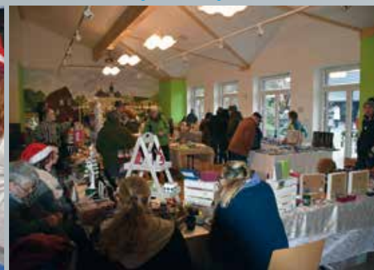
◀ Weihnachtsmarkt in Gartrop ▶