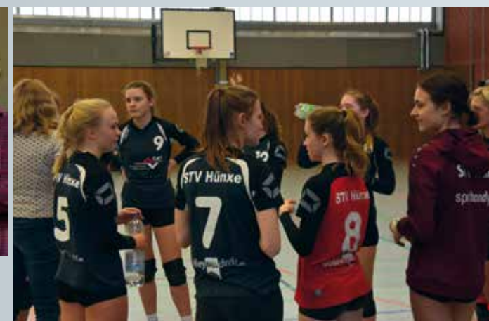
◀ Volleyball Damenteams II + III des STV ▶