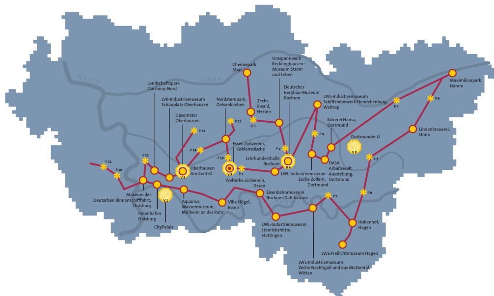
Abb. 8.03: Route der Industriekultur

In der Abbildung 8.03 werden die Panoramen der Industrielandschaft, die Ankerpunkte der Route, das zentrale Besucherzentrum und die Visitorcenter dargestellt.